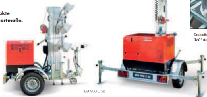
EFA 900 C S6