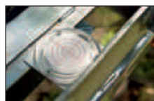
Schnelle und sichere Ausrichtung