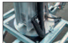
Drehteller vollverzinkt, 360° drehbar, stufenlos